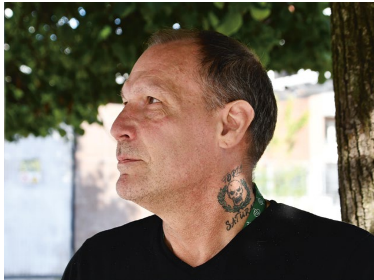
Att Hammarby är laget i Charlies hjärta behöver man inte tvivla på.

– Under ett av mina straff kom jag in i tolvstegsprogrammet. Det var då jag insåg att jag måste berätta om övergreppet i de tidiga tonåren. Jag var så nervös innan jag skulle dela detta så jag spydde som en tok. Det