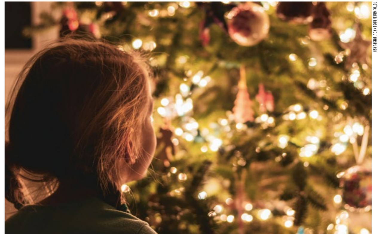
Trots att vi kallar julen barnens högtid är det då – och vid midsommar – som svensk alkoholkonsumtion når årets topp.