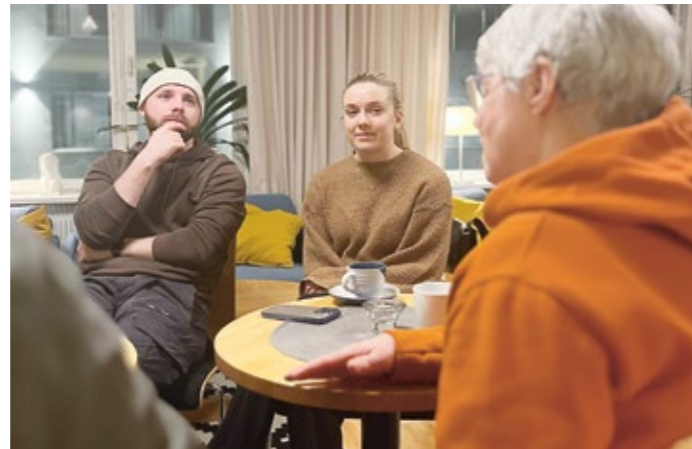
Besöksgruppen möter människor varje vecka som sitter i häktet i Umeå. De får ofta intressanta samtal. De häktade uppskattar besöken och gruppen är efterfrågad enligt personalen