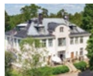
TORPAHEMMET Vieback Björkhaga, 571 91 Nässjö Tel 0380-37 35 85, torpa@ lp-verksamheten.se

Hur gör man om man vill veta mer eller vill försöka komma till Torpa?