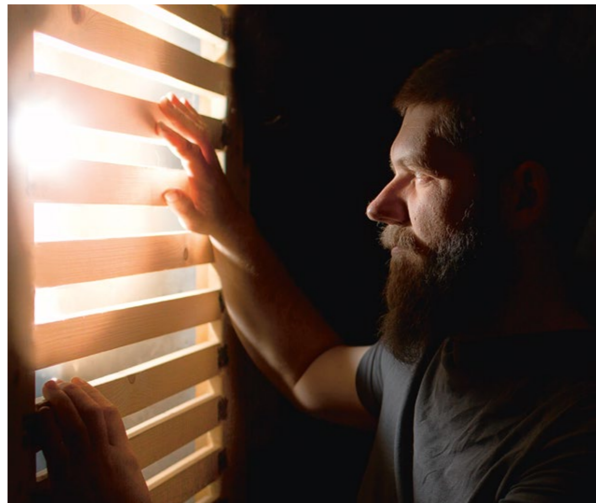
Personen på bilden är inte textens författare.

När man varit på ett ställe mellan 6-12 månader kan man känna sig frustrerad och det beror på att man vill fly och det är helt