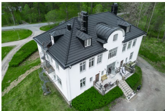
Torpahemmet mansavdelning, Viebäck