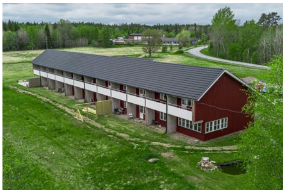
Torpahemmet kvinnoavdelning, Viebäck